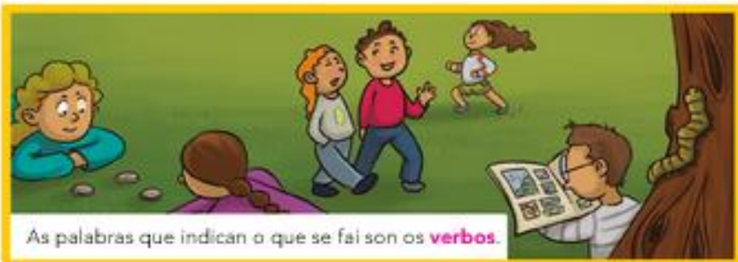
As palabras que indican o que se fai son os verbos .