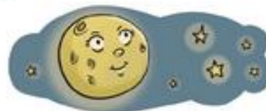
Onte había lúa chea.