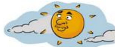
Hoxe hai moito sol.